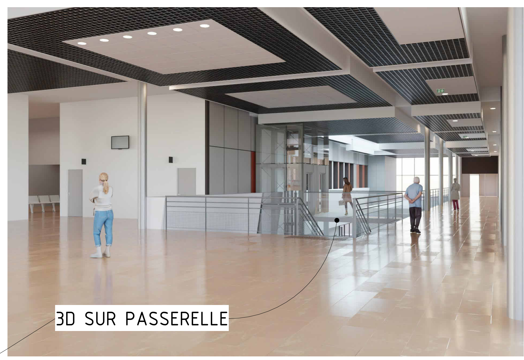
VUE EN PLAN DALLE HAUTE SS1 (0.00 / 288.74 ) CREATION ASCENSEUR (vue bas SS1 vers 0.00)